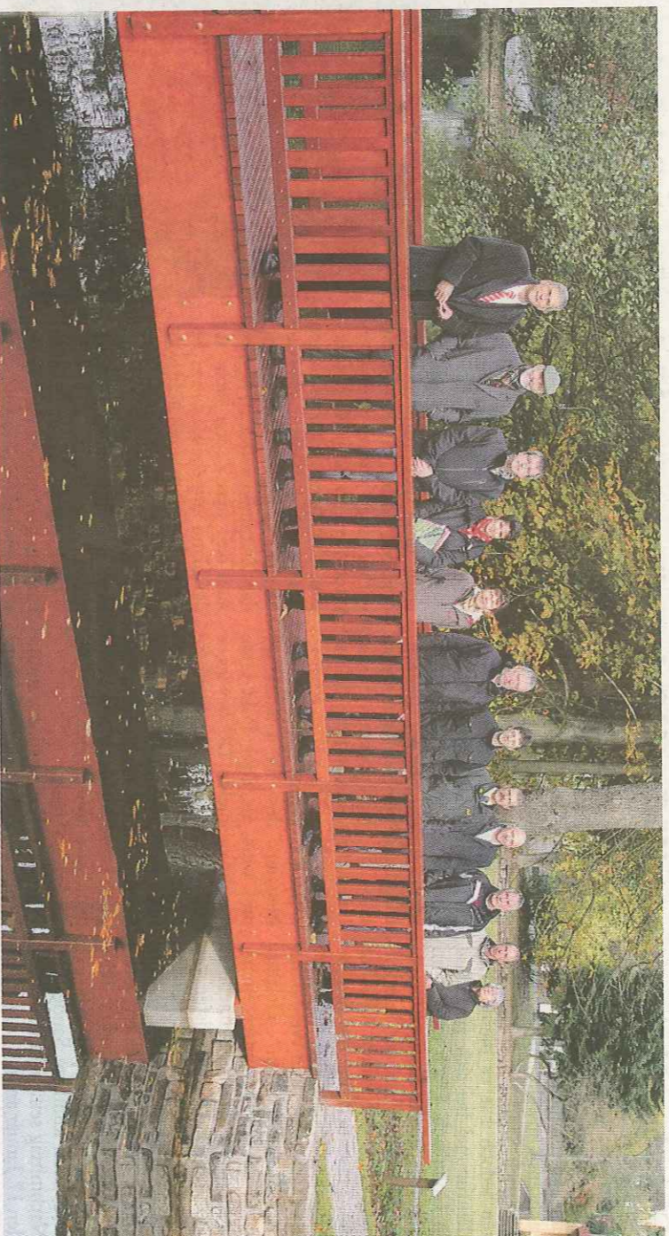
Brückeneinweihung mit Ehrengästen in Neuhaus: Das rote Schmuckstück kommt bei Einwohnern und Gästen sehr gut an.

Herzstück der Neugestaltung ist die neue Brücke, die von der Teichwiese zur Fohlenplackerer Straße den Teich überspannt. Unter Beobachtung zahlreicher Neuhauser Bürger war sie im