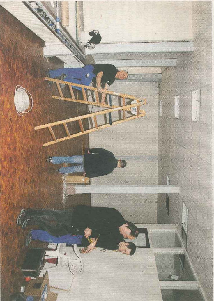
Im ehemaligen Foyer sind die Handwerker aktiv. Neue Wände wurde bereits eingezogen.

Interkommunale Tourismus-Zentrale) einziehen. 300.000 Euro kostet der Umbau für die Umnutzung eines Teilbereichs des Hauses des Gastes. Unter anderem wird eine separate, vom übrigen Heizkreislauf des Hauses abgekoppelte, neue Heizung eingebaut. Die Maßnahme wird mit Leander-Mitteln der Europäischen Union gefördert, so dass die Stadt Holzminden, die Eigentümerin des Gebäudekomplexes ist, 150.000 Euro aufwenden muss. Von der ITZ im Haus des Gastes werden künftig die touristischen Angebote der Kommunen Bevern, Bodenfelde, Bodenwerder-Polle, Eschershau-